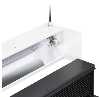
Access to lamp and product maintenance