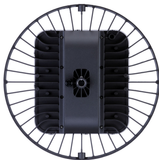
GreenPerform Highbay G3 BY698P Fixed Back