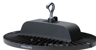
GreenPerform Highbay G3 BY698P Fixed Side