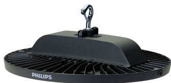
GreenPerform Highbay G3 BY698P Dali Side