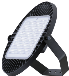
GreenPerform Highbay G3 BY698P with Bracket