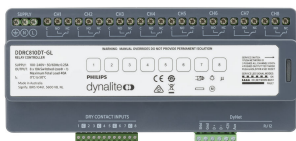
Front of the DDRC810DT-GL 8 x 10A Relay Controller